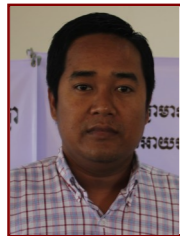
ហៀង សោកា អភិបាលក្រុងបាត់ដំបង រោងចក្រ ០១២៩៤៤៤៤